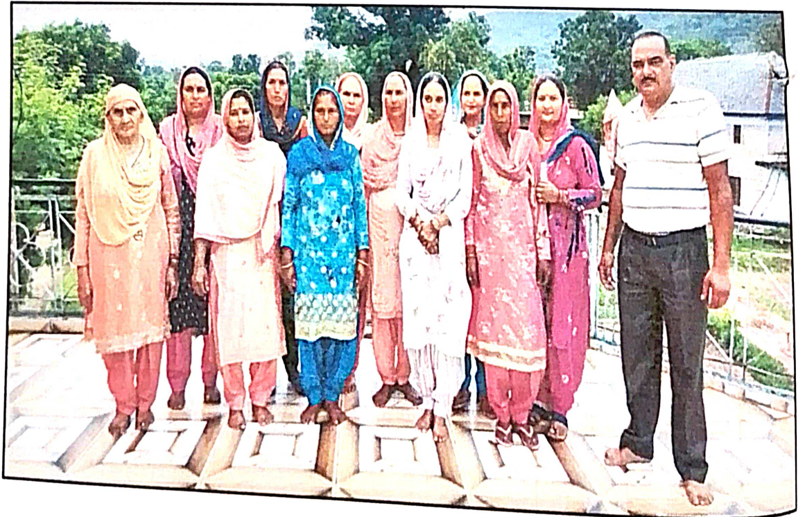
शिवम् स्वयं सहायता समूह के सदस्य प्रधान वन ग्रामीण विकास समिति डाहड के साथ