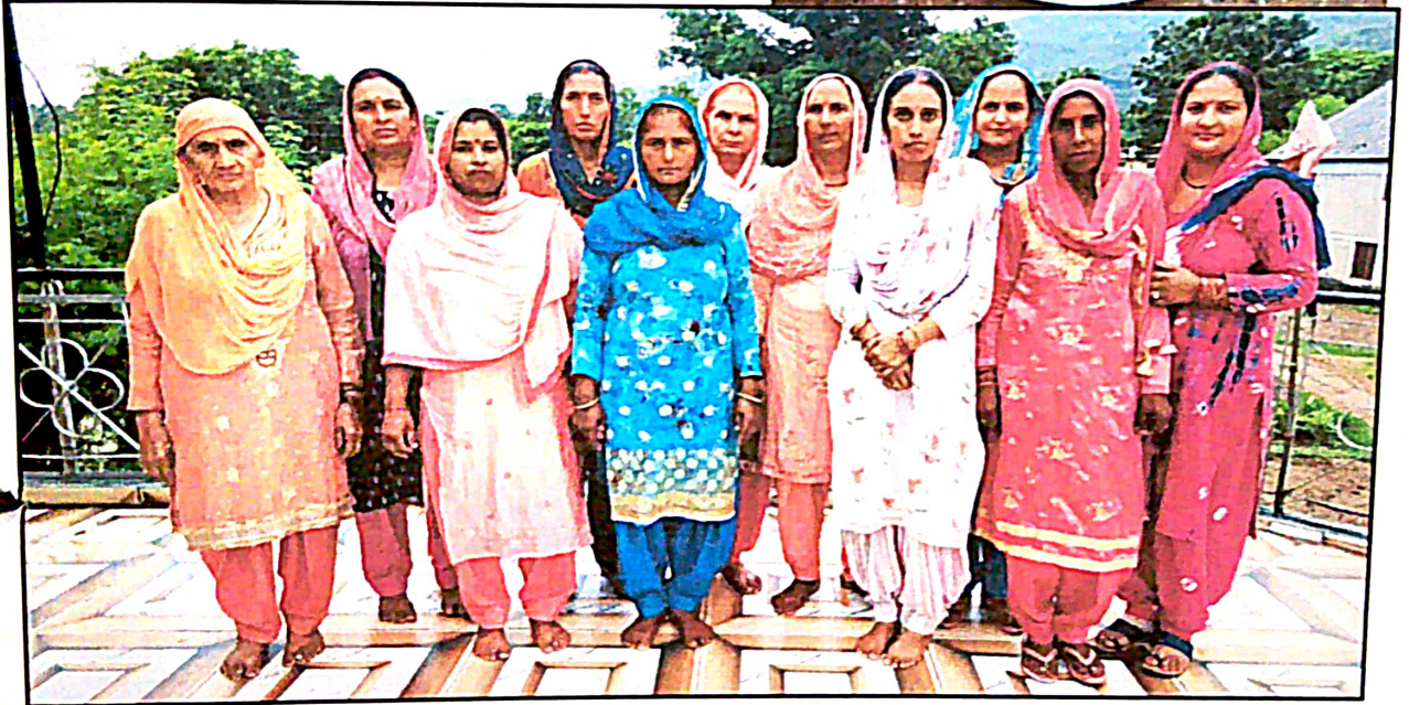
ग्रामीण वन विकास समिति डाहड का शिवम् स्वयं सहायता समूह